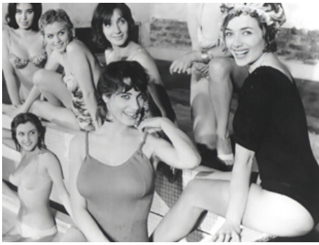
1960 LES BONNES FEMMES de Claude Chabrol avec Bernadette Lafont, Stéphane Audran