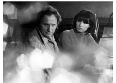
1974 COMME DES OMBRES JUMELLES de Dirk Sanders avec Ivry Gitlis