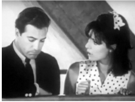
1964 MEURTRES AU SOMMET (Der Chef wünscht keine Zeugen) d'Hans Albin & Peter Berneis avec G. Rojo