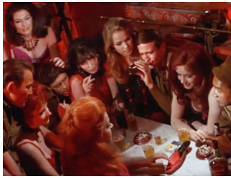
1969 UN CHÂTEAU EN ENFER (Castle Keep) de Sydney Pollack