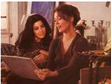
1971 LA MAISON SOUS LES ARBRES de René Clément avec Faye Dunaway