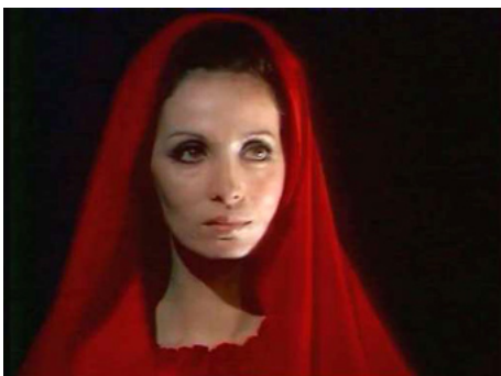
1975 ALOUQA OU LA COMÉDIE DES MORTS de Pierre Cavassilas