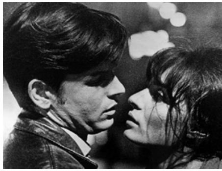
1962 LE PAIN DES JEUNES ANNÉES (Das Brot der frühen Jahre) d'Herbert Vesely avec Christian Doermer