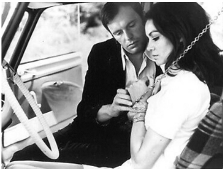
1969 LE VOLEUR DE CRIMES de Nadine Trintignant avec Jean-Louis Trintignant