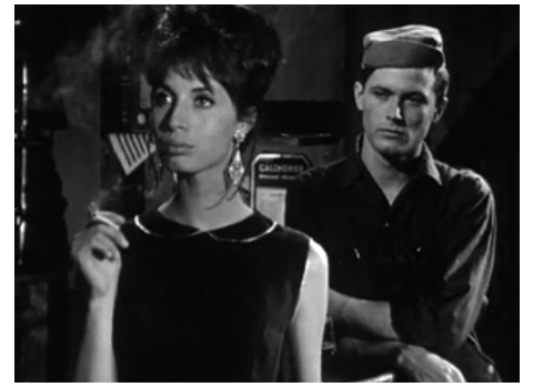
1962 HOLD-UP À BERCY de Jean-Paul Carrère avec Dirk Sanders