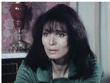
1977 OÙ VONT LES POISSONS ROUGES ? d'André Michel