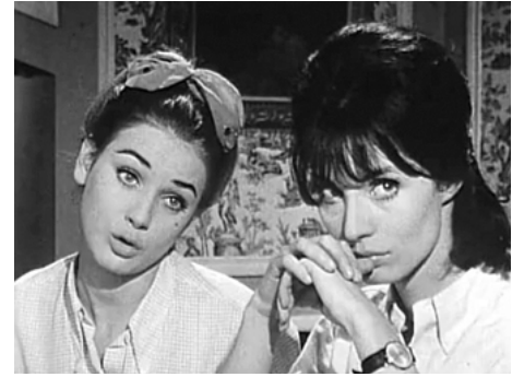
1965 UNE CHAMBRE À LOUER de Jean-Pierre Desagnat avec Geneviève Grad