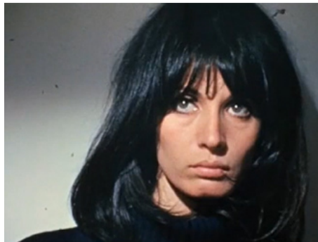
1967 LOIN DU VIETNAM, Claude Ridder d'Alain Resnais